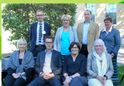
Bibsamkonsortiets styrgrupp 2014.

2015 inleds ett pilotprojekt i systemet JUSP rörande användningsstatistik.