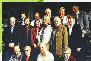
BIBSAM:s referensgrupp 1998.