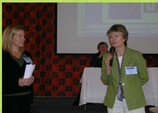
2007 ICOLC, Stockholm.