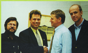
1998 avtal med Academic Search Elite.

1997-2002 licensavtalen subventioneras av statliga medel.